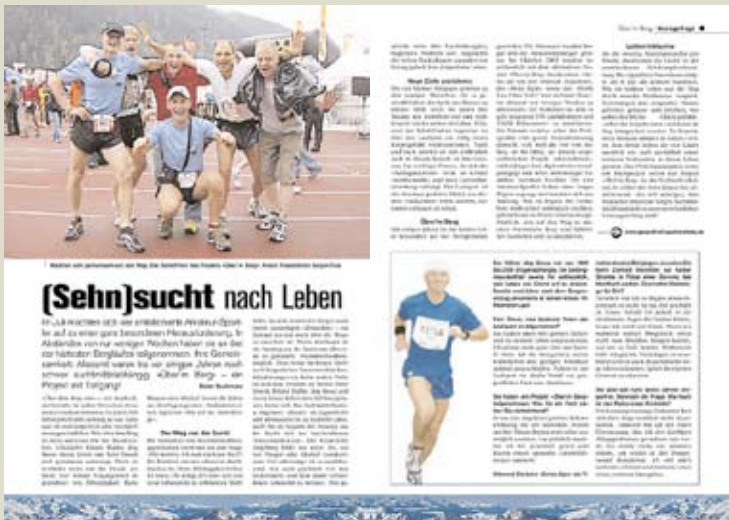
(Presstext „Walliser Bote“, Schweiz, August 2006)

Im Frühjahr 2007 erscheint das Buch zum Projekt: Jürgen Fais, „Über'm Berg (Sehn)sucht nach Leben“.